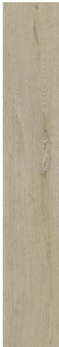
TAUPE 20 x 121 cm (8" x 48") fini mat DE.NB.TPE.0848