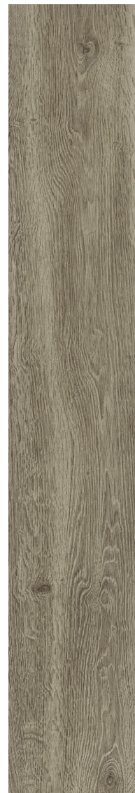
BRUN 20 x 121 cm (8" x 48") fini mat DE.NB.BWN.0848

Tous les items présentés dans ce document font partie du programme d'inventaire Olympia. Pour les commandes spéciales, veuillez contacter votre représentant de Tuiles Olympia.