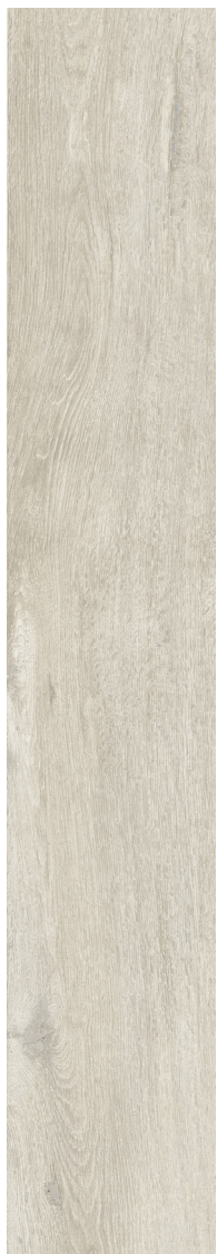
NEUTRAL (Blanc) 20 x 121 cm (8" x 48") fini mat DE.NB.NTR.0848