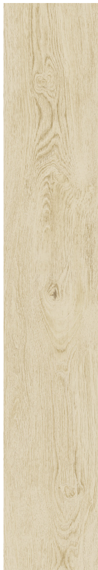
NATUREL (Beige) 20 x 121 cm (8" x 48") fini mat DE.NB.NAT.0848